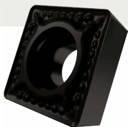
SCET – AU CHOIX